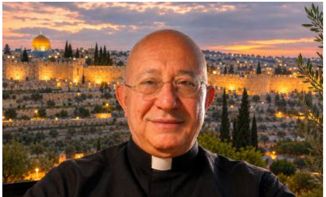
Primo piano con la Porta Bella del tempio nello sfondo

C'è una frase della Bibbia che porta sempre con sé,