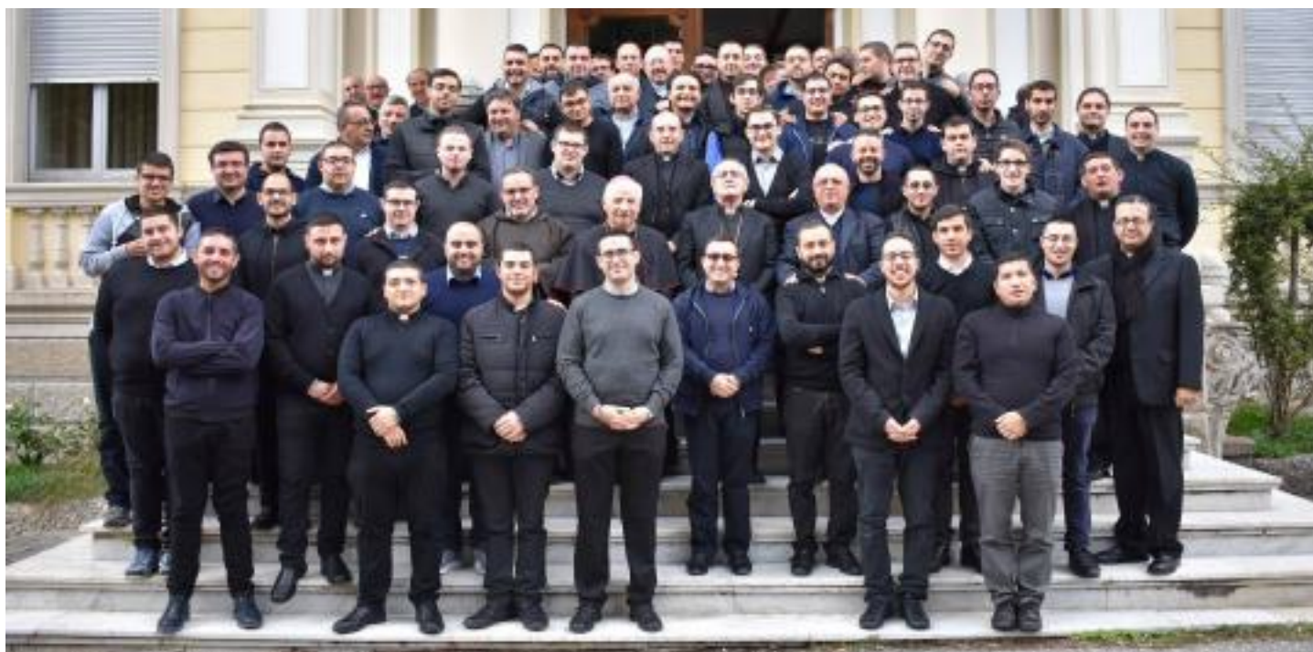
Alunni e Superiori del Seminario Teologico di Catanzaro (2018)

Ho dedicato la mia vita allo studio in particolare della Bibbia ebraica, ma anche all'insegnamento e alla predicazione della parola di Dio. Per Bibbia ebraica, com'è noto, si intendono quei testi della Bibbia collocati nell'epoca precedente alla nascita di Gesù. Nel suo insieme, la Bibbia è certamente un'opera antica, sia dal punto di vista storico sia letterario, scritta all'incirca tra il 700 a.C. e il 100 d.C. Da qui nasce la necessità di interpretarla e di leggerla alla luce della mentalità, del contesto e delle finalità proprie dell'epoca e degli autori che l'hanno composta. Sarebbe infatti un errore leggerla o attualizzarla senza la necessaria interpretazione. Oggi, comunque, non mancano strumenti e sussidi che permettono di acquisire una buona preparazione biblica anche senza frequentare corsi specialistici. Se interpretata correttamente, la Bibbia diventa un libro sempre attuale, perché attraverso di essa Dio continua