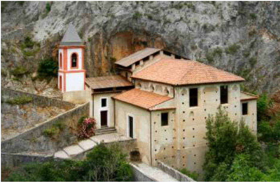
Santuario di Santa Maria di Costantinopoli (Papasidero)

rappresentativo di tutti i popoli della terra. La Bibbia è il libro più venduto al mondo. È stato ironicamente detto che noi cattolici la amiamo tanto da aver paura di sciuparla, sfogliandone le pagine! I miei studi nascono, in verità, dall'approfondimento di alcuni temi o argomenti che ho voluto mettere per iscritto per l'utilità dei miei studenti e, in un secondo momento, per un pubblico più ampio e interessato. Non ho mai avuto la pretesa di fare ricerca per la ricerca, ma ricerca per il bene e l'utilità degli altri.