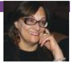
di Sina Mazzei