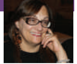
di Sina Mazzei