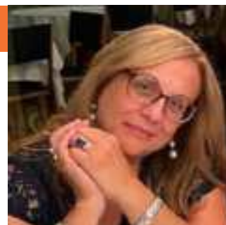
di Teresa Notte